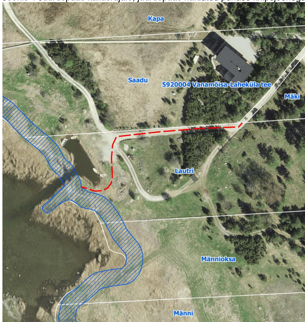
Joonis 4 Juurdepääs kallasrajale, juurdepääs näidatud punase kriipsjoonega