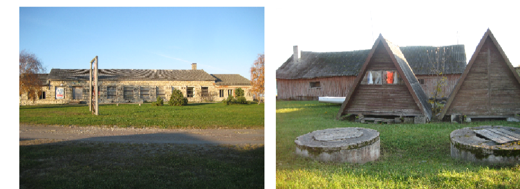
Vaated planeeritava alale

ILLIKU LAIU DETAILPLANEERING Töö staadium: Detailplaneering Töö nr: 348.2011 Tellija: Orissaare Vallavalitsus Joonis: Tugiplaan Joonise nr: 2 Mõõtkava: 1:1000 Väljaprinti aeg: 11.01.2013