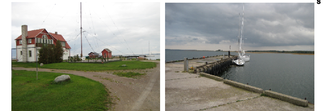
Vaated planeeritava alale