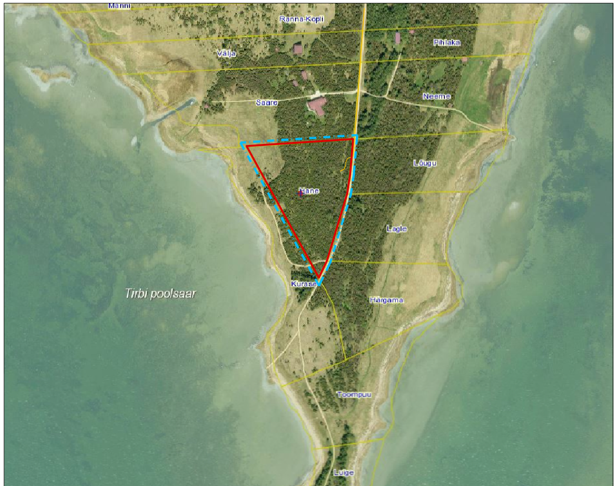
Aluskaart: Maa-ameti geoportaali väljavõte