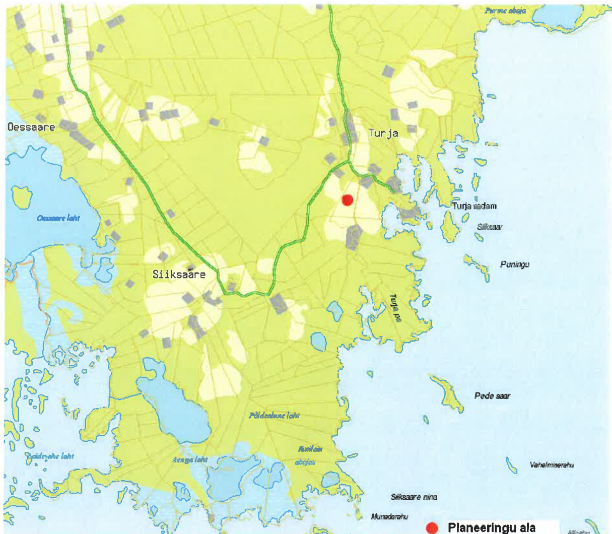
JOONIS 1. Detailplaneeringu maa-ala asukoha skeem

Planeeringualast põhjapoole jääb Kellamäe-Turja riigimaantee nr T-21160. Idast külgneb planeeritav ala 3 meetri laiuse kruusast kattega vallateega. Lõunasse jäävad maatulundusmaa sihtotstarbega kinnistud Anni (katastritunnusega 85801:005:0145) ning Nigula (katastritunnusega 85801:005:0157). Läände jääb maatulundusmaa sihtotstarbega kinnistu nimetusega Jaani (katastritunnusega 85801:005:0233)