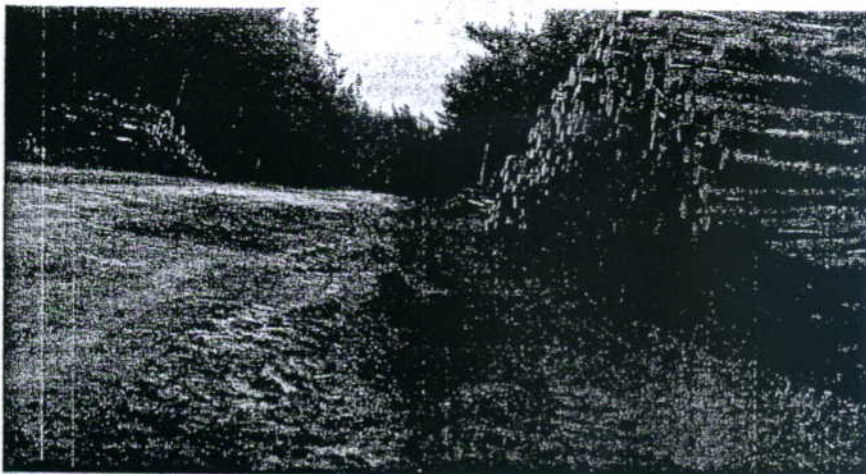
Kihelkonna valla juhtide arvates saab valla teid kaitsta vaid metsafirmadelt raha nõudes.