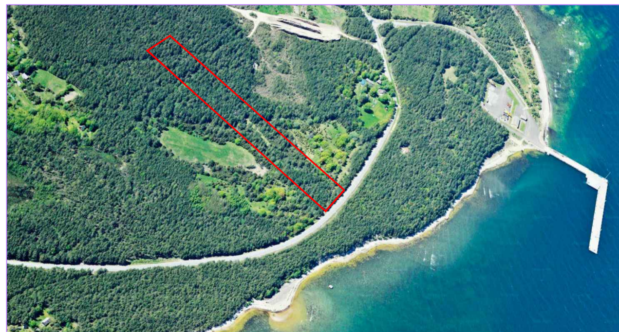
Olemasolev olukord. pildistuse aeg 31.05.2020.