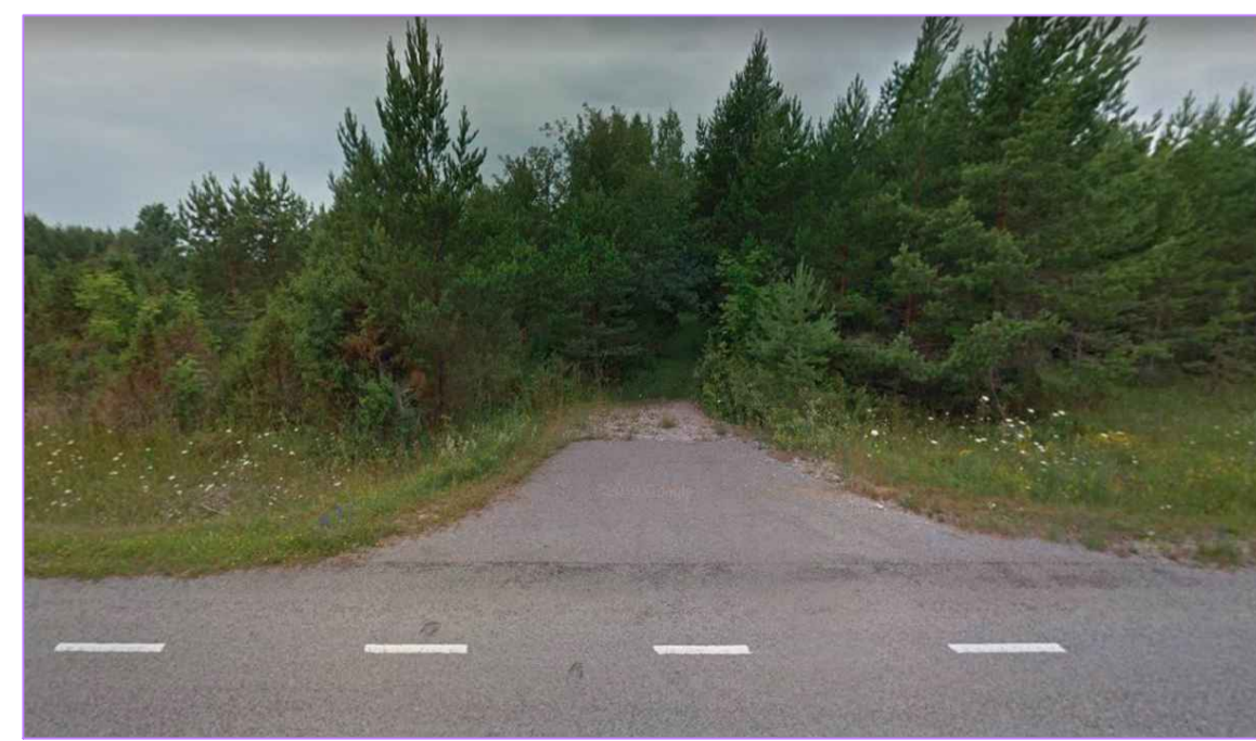
Olemasolev mahasõit maanteed Poltsina kinnistule.