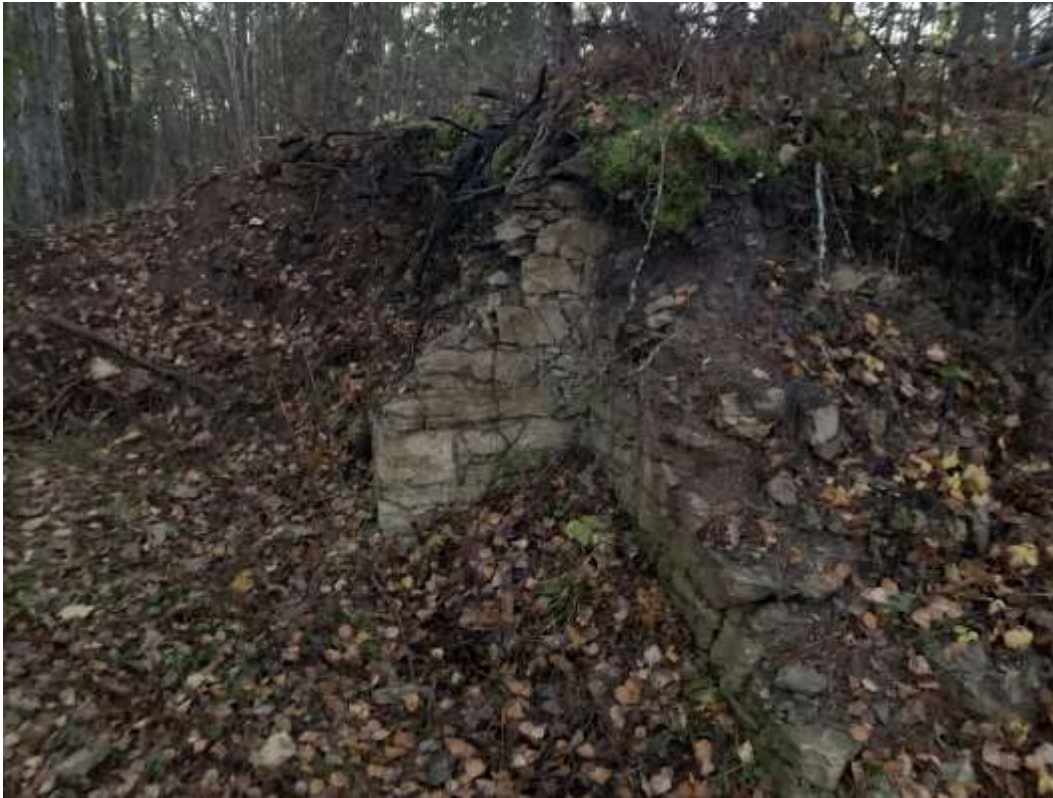
Foto 1 Angervaksa maaüksusel nähtav tellisetööstuse hoone säilinud osa.

Juurdepääs maaüksusele läbib hetkel Merela kinnistut. Kui Merela kinnistu omanikuga tee kasutamise osas kokkuleppele ei jõuta, siis on võimalik olemasoleva mahasõidu kaudu rajada uus tee piki Angervaksa kinnistu idapoolset piiri.