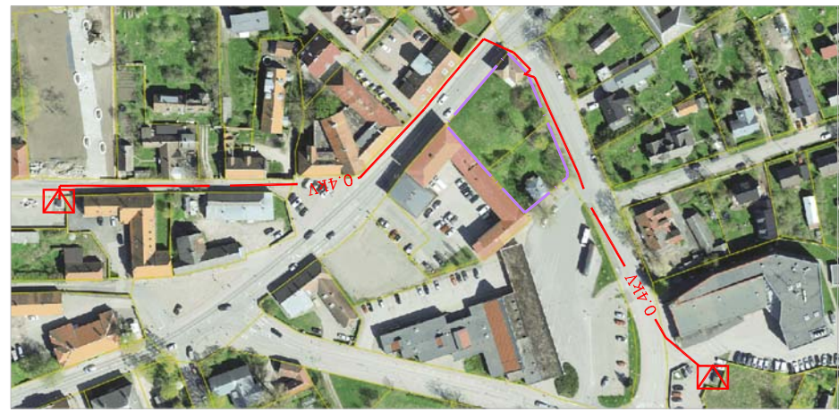
ELEKTRILIITUMISE SKEEM M 1:6000