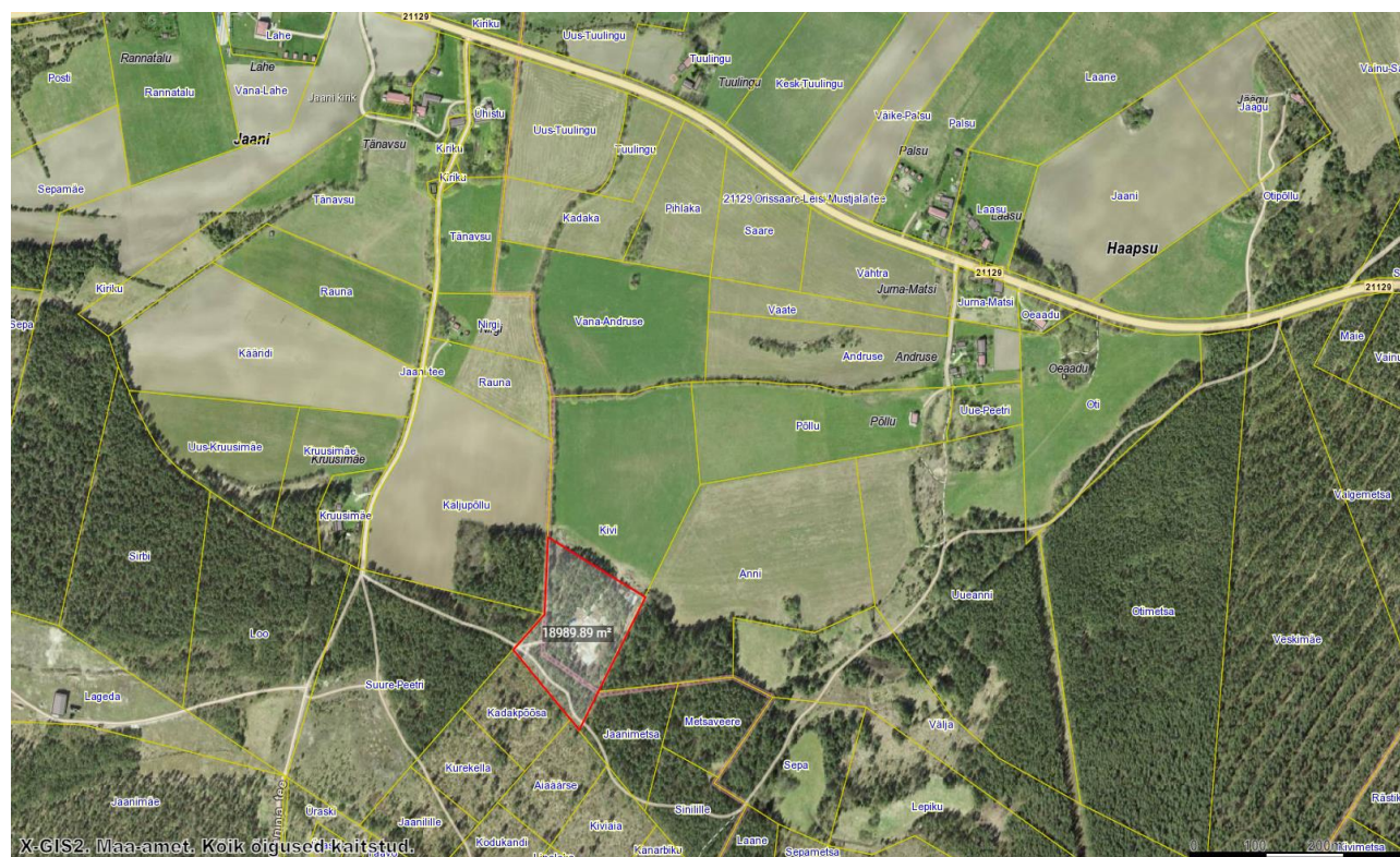
Joonis 1. Planeeringuala asendiskeem

Planeeringuala, suurusega ca 1,9 ha, asub Saaremaa valla Haapsu küla põhjapoolses osas, hõredalt asustatud alal.