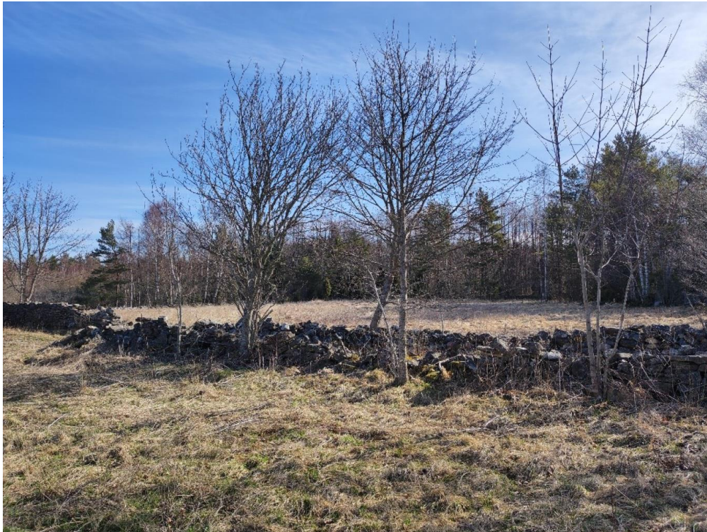
Foto Vaade planeeringualale. (, 20.04.2022)

Rohekoridori aladele ehitades peab vähemalt 70 m laiune looduslikest aladest moodustuv (sh olemasoleva haljastusega või rajatava haljastusega) koridori riba jääma katkematuks (ehk sidusaks), välja arvatud detailplaneeringus märgitud abihoone asupaigas. Sidususe tagamiseks on võimalik rakendada kompenseerivaid meetmeid (metsastamine, põõsarinde rajamine, puude istutamine võrde liitumisega, jms);