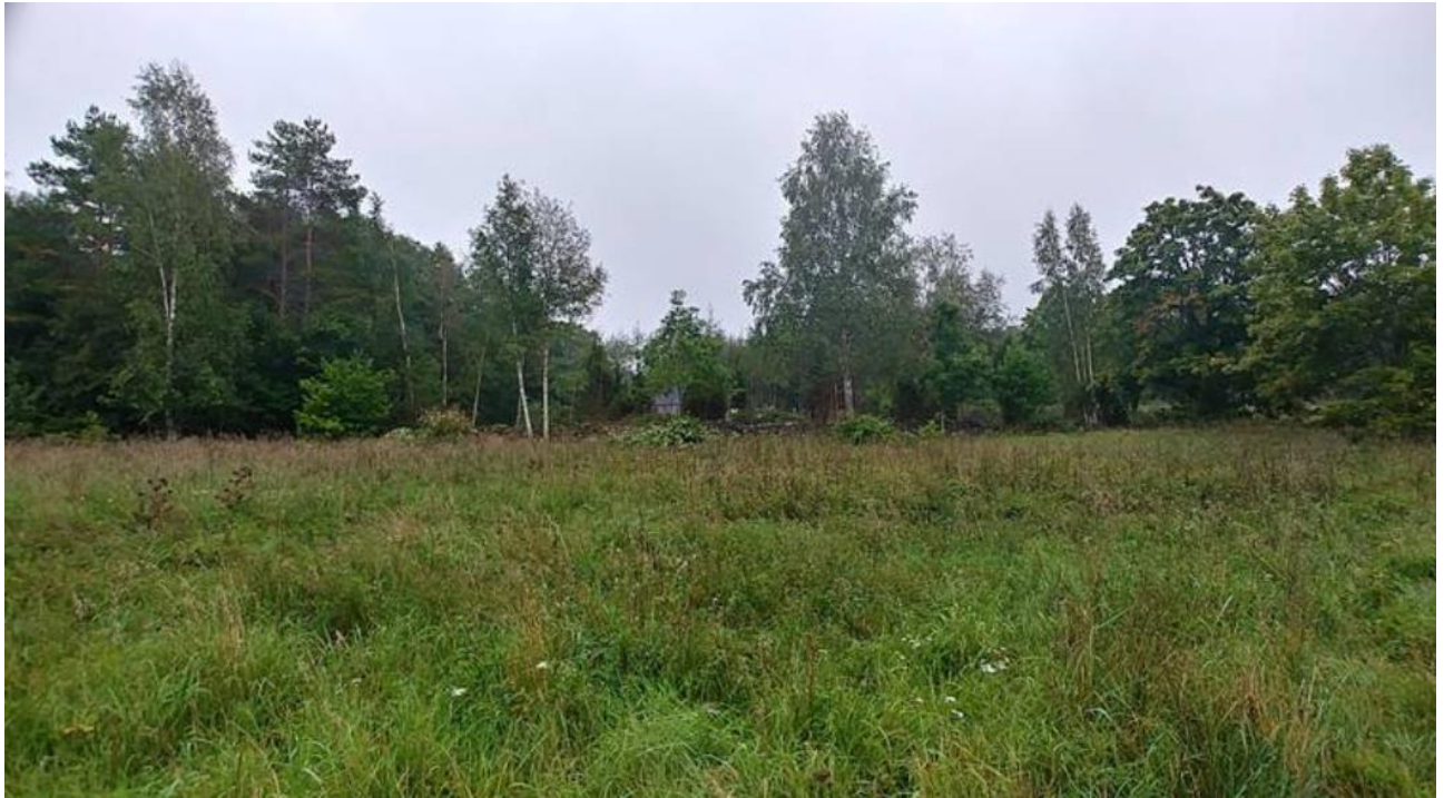
Foto: vaade kavandatava õuealalt ajaloolise Liiva talu suunal põhjast lõuna suunal

Detailplaneeringus on vähendatud rohekoridori laiust 70 meetrilt 60 meetrile lühikesel lõigul Liiva katastriüksusel abihoonel asukoha osas. Tagada tuleb täiendavalt leevendava meetmena, et uute piirete rajamist hoonestuse rajamisega seoses ei toimu ning Liiva ajaloolise ja kavandatava õueala vaheline ala säilib looduslikuna. Pidades silmas koridori kitsenduse ulatust (vaid lühikesel lõigul ei ole tagatud 70 m vahekaugus hoonestuste vahepeal), ei sea see ohtu rohekoridori toimivust või rohevõrgustiku üldist sidusust.