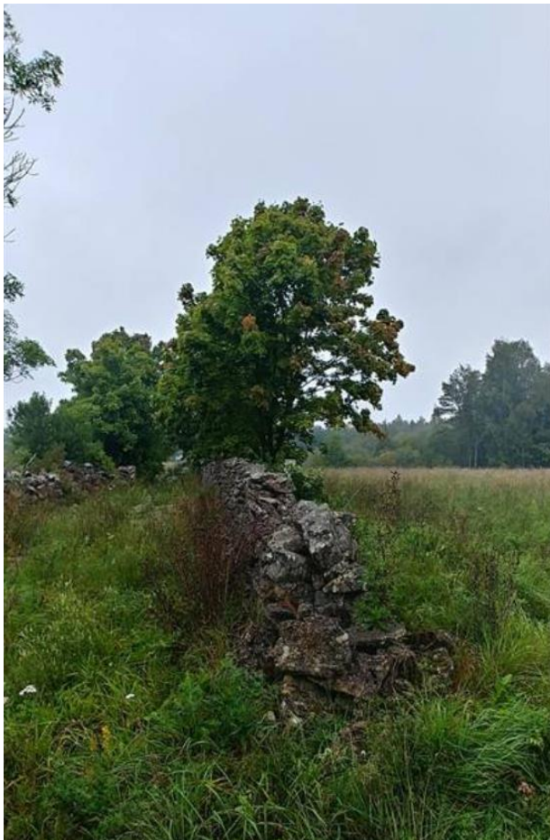
Foto: vaade hoonestatavale alale paremal ja kiviaedadega piiratud külatänakule lõunast põhja suunal.

Hoonestusala on kavandatud ajalooliselt ca 1,5 m kõrguse kiviaiaga piiratud põllulapile, mis ei ole enam põllumajanduslikus kasutuses. Plaanitav hoonestusala on ümbritsetud igast küljest kiviaiaga, olemasoleva kiviaia ning kavandatava hoonestusala vahele jääb põhjast ja idast suurem puhverala (20-50 m). Planeeringuga ei kavandata uute piirete rajamist, algupärase kõrguses on kavas olemasolevad kiviaiad taastada - muuhulgas ka hoonestusalani viiv ajalooline külatänak (fotol).