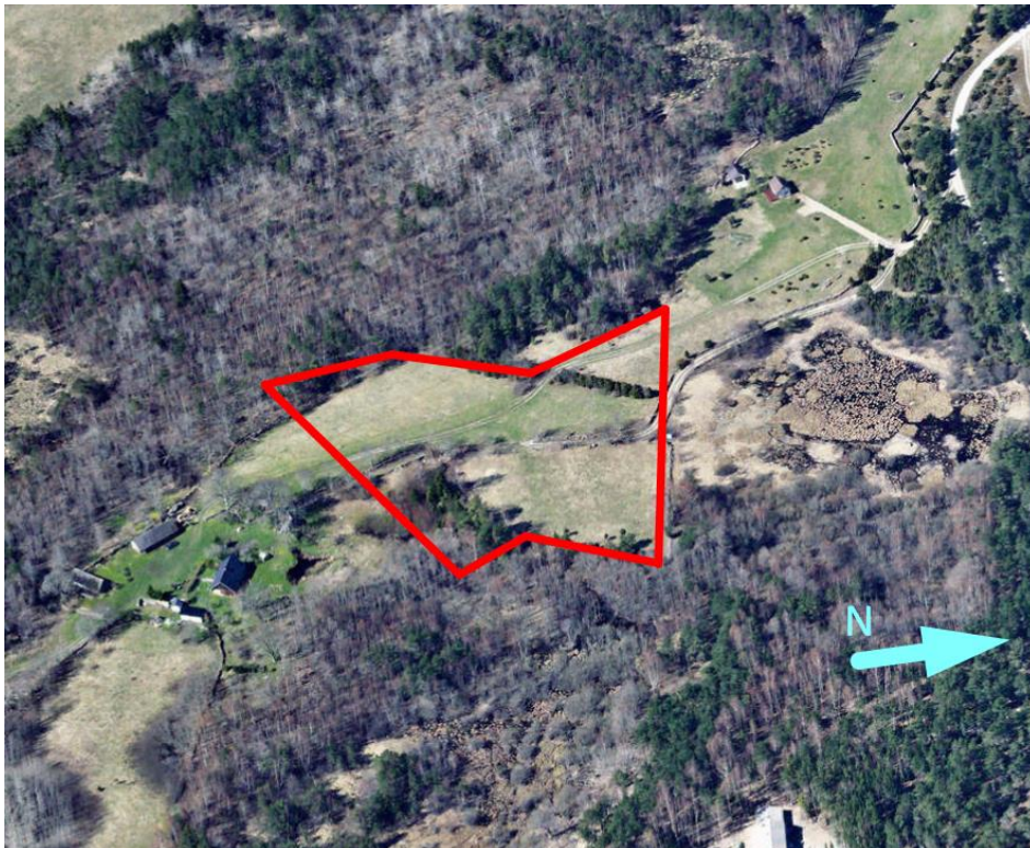
Planeeringuala mõjuala kaldaerofoto, 12.05.2021

Ümbritsevad katastriüksused on valdavalt maatulundusmaad. Piirkonnas on üksikud põllud, kuid enamasti on kaetud kõrghaljastusega.