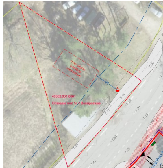
väljavõte maanteeprojekti proj. immutusalaga