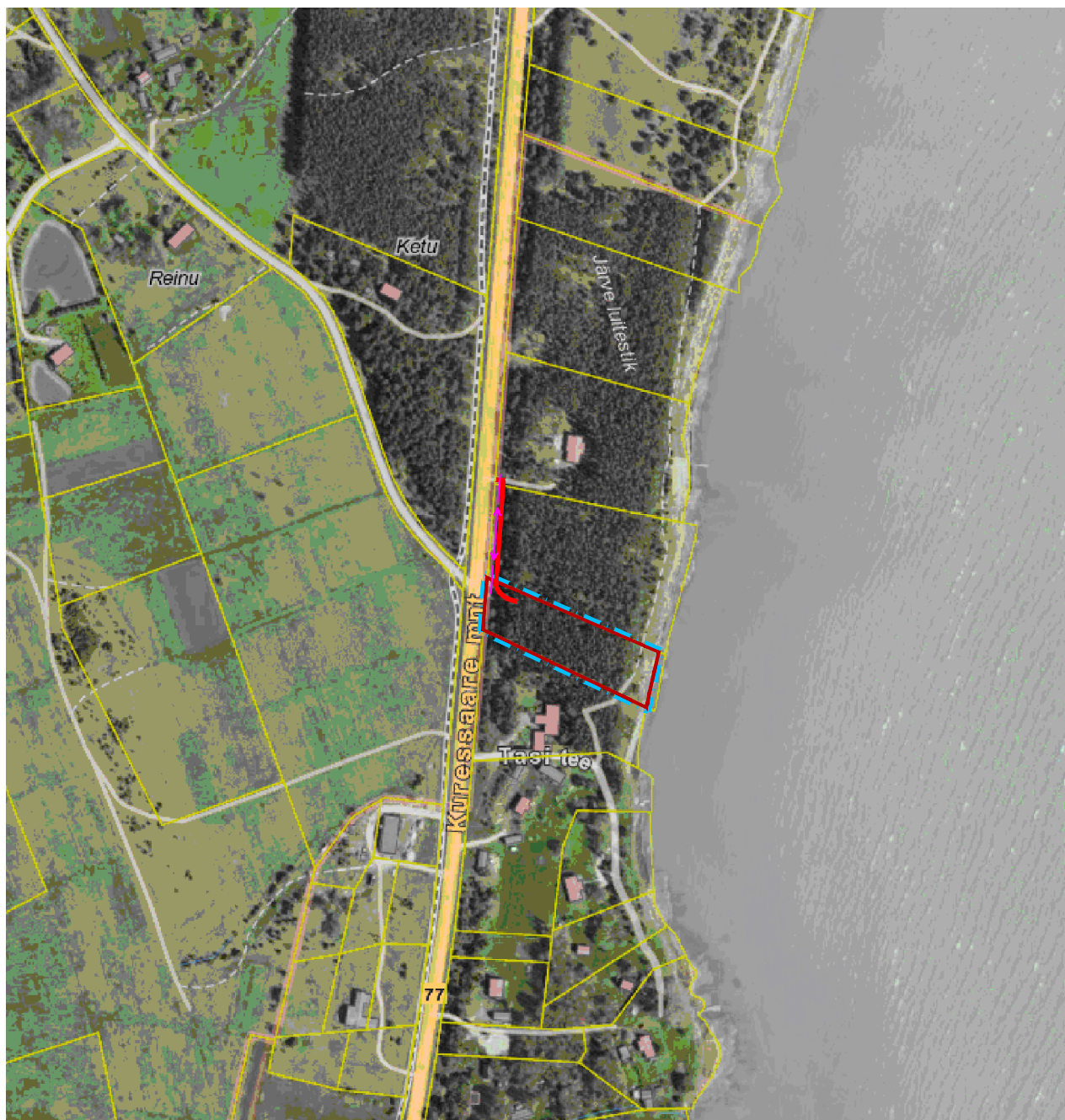
Aluskaart: Maa-ameti geoportaali väljavõte