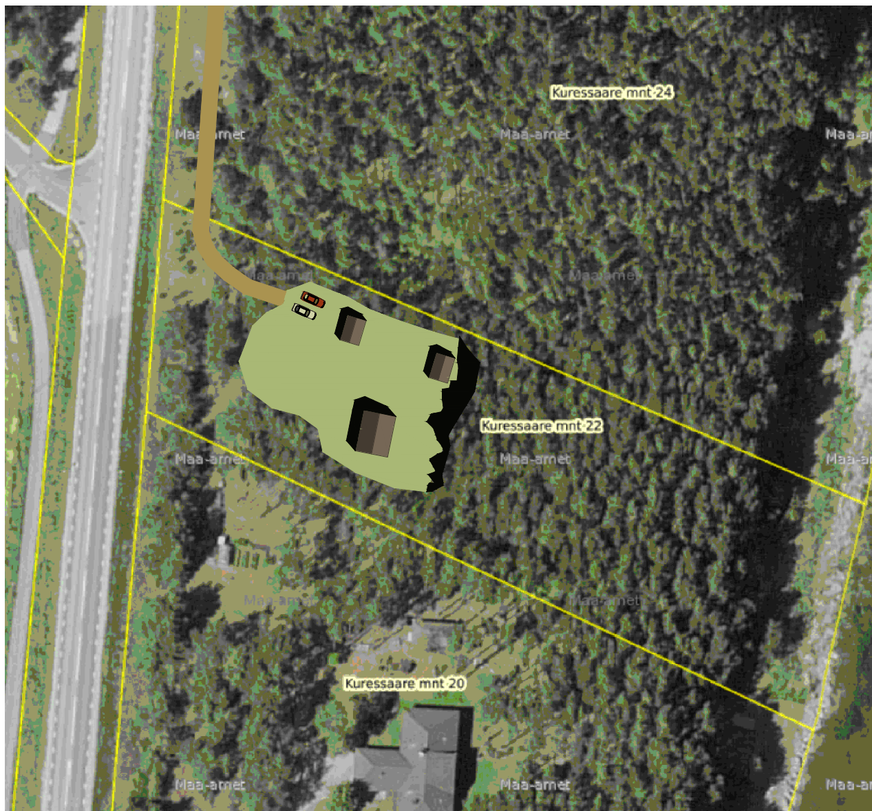
Aluskaart: Maa-ameti geoportaali väljavõte