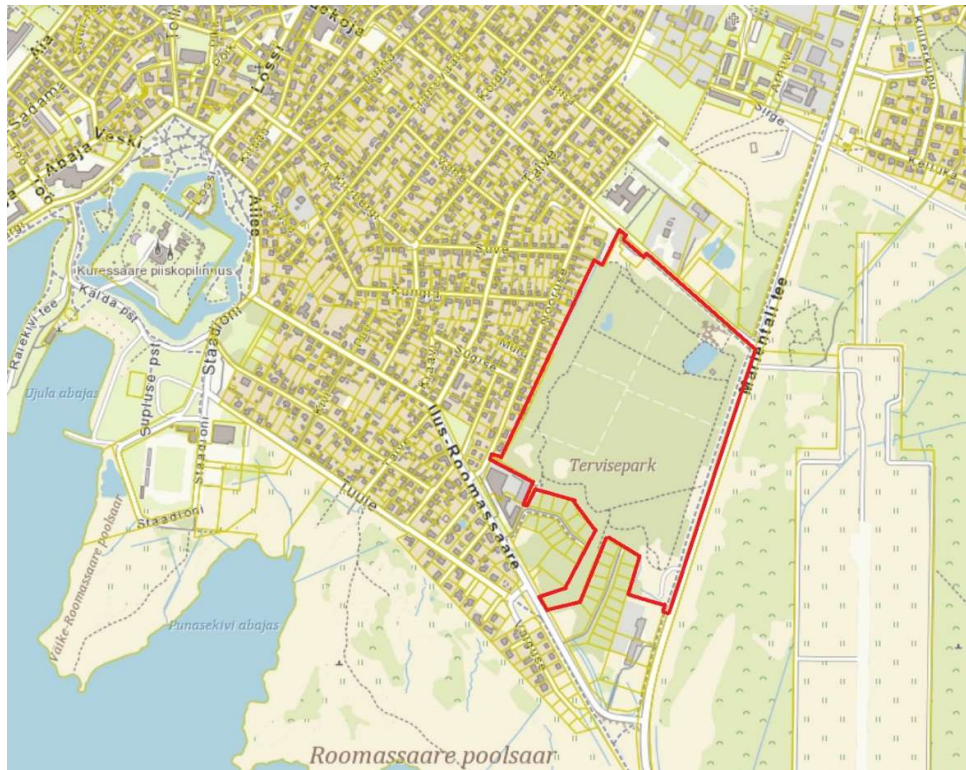
Pilt 1. Väljavõte Maa- ja Ruumiameti geoportaalist. Planeeringuala asukoht on markeeritud punase kontuuriga.

Eeltoodule lisaks on terviseparki 2022ndal aastal ehitatud viihall radade hooldustehnika hoiustamiseks ning konteinerpumppla, 2023ndal aastal on rajatud hooldemeistrite soojak ja turvaaed viihalli ümber ning hoone finiši- ja stardialas. Välja on ka ehitatud peasissepääsu parkla.